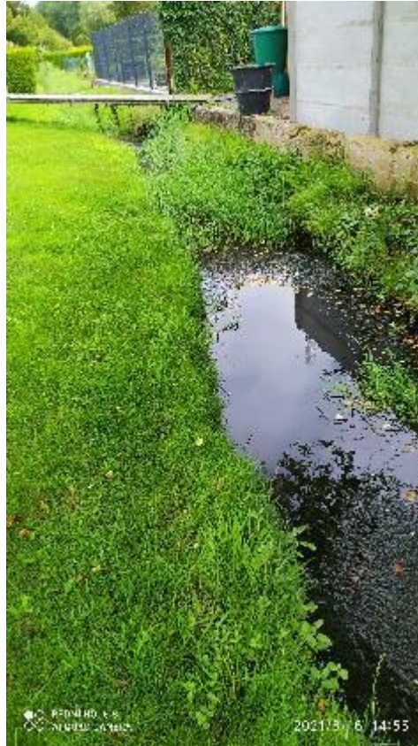
vor den Unterhaltungsmaßnahmen

In der Ortsratsitzung im April 22 wurden diese Fotos in der Präsentation der Verwaltung bereits vorgestellt.