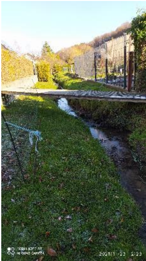
nach den Unterhaltungsmaßnahmen