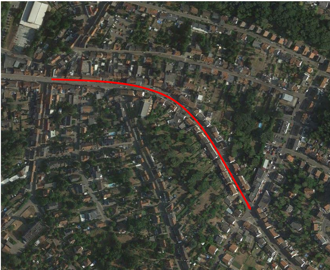
Obere Kaiserstraße | Tempo 30 Bereich in Rot